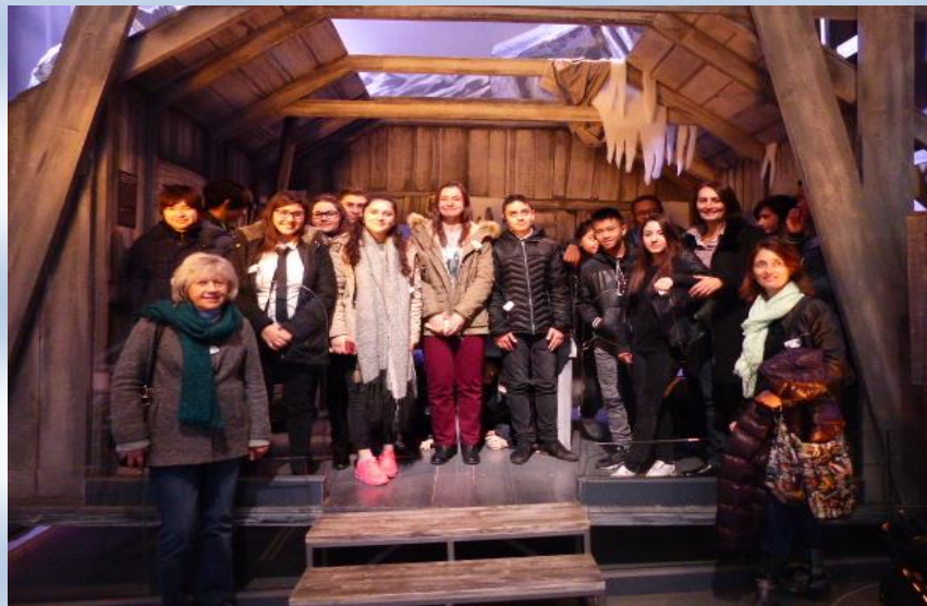
Tout le groupe dans le décor de la cabane penchée présente dans « La ruée vers l'or ».

Le mécanisme fait pencher la cabane de droite à gauche, accrochez-vous !