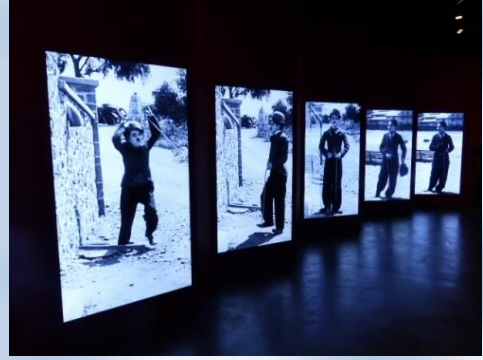
C'est un musée moderne. écran. tablettes tactiles.

Nous sommes partis le vendredi 9 Décembre à 8h15 en direction de la Suisse.